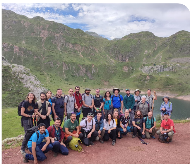
Figura 1. Participantes de la primera edición de SEBOTA frente al Lago de la Cueva, Saliencia (17 de junio de 2023).

Desde el recientemente creado Grupo de Trabajo en Divulgación y Salidas de Campo de la Sociedad Botánica Española (SEBOT) hemos impulsado una iniciativa que tiene como objetivo principal fomentar la interacción entre miembros y profesionales de la botánica en entornos de gran diversidad vegetal, a la que hemos acuñado el nombre de "SEBOTA". Desde el grupo organizador hemos planteado este evento como un encuentro de un fin de semana en el que realizar excursiones de campo a diferentes lugares de interés botánico acompañados por expertos locales.